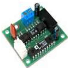
Модуль интерфейса RS485 для EI-9011 (PCB-RS485-1)

Модуль интерфейса (конвертер интерфейса) PCB-RS485-1 используется для расширения функциональных возможностей преобразователей частоты серии EI-9011 при построении систем управления различными технологическими процессами. Интерфейс RS-232 преобразуется в интерфейс RS-485. Максимальная скорость обмена составляет 9600 бод. Плата обеспечивает управление группой преобразователей частоты по одной физической линии по интерфейсу RS-485.