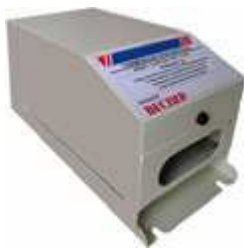
Тормозной прерыватель EI-BR

Тормозной прерыватель используется для подключения тормозного резистора к преобразователю частоты при быстром торможении двигателя.