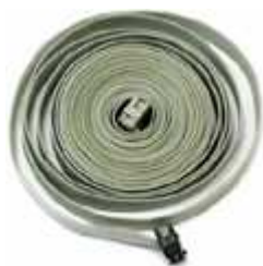
Шлейф удлинительный пульта управления

Шлейф удлинительный позволяет вынести встроенный пульт управления преобразователей EI-7011, EI-9011, EI-P7002 на переднюю панель шкафа (оболочки) при проектировании систем управления. Длина шлейфа оговаривается при заказе. Максимально - до 10 м.