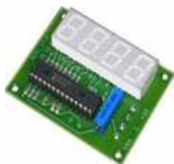
Плата аналогово-цифрового преобразователя ADC-1

Плата предназначена для отображения в цифровом виде сигнала параметра, снимаемого с аналогового выхода преобразователя частоты (выходной частоты, тока и т.д.).