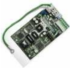
Модуль интерфейса PROFIBUS-DP для EI-9011 (EI-SP-P1)

Модуль интерфейса (конвертер интерфейса) PCB-RS485-1 используется для расширения функциональных возможностей преобразователей частоты серии EI-9011 при построении систем управления различными технологическими процессами. Интерфейс RS-232 преобразуется в интерфейс RS-485. Максимальная скорость обмена составляет 9600 бод. Плата обеспечивает управление группой преобразователей частоты по одной физической линии по интерфейсу RS-485.